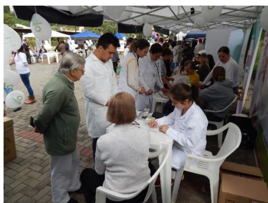
Verificação arterial e Diabete

No dia 16 de maio foi realizado o evento “ HIPERDIA SOLIDÁRIO”, juntando dois eventos tradicionais do município: Hiperdia e Dia Solidário , com a integração de novas empresas parceiras, sendo o CSIC um dos promotores e organizadores do evento. Dessa forma a população de Videira e região pode aproveitar diversos serviços de bem individual e comum de forma gratuita, como: a verificação da pressão arterial, glicemia, índice da massa corporal e orientação sobre o uso de medicamentos e hábitos saudáveis. Houve a oportunidade da coleta de mais de mil litros de óleo de cozinha para reciclar. Foi um momento de convivência e integração em um ambiente agradável, com roda de chimarrão, distribuição de frutas, brindes, orientação sobre alimentação saudável, brinquedos para as crianças e atividades lúdicas.