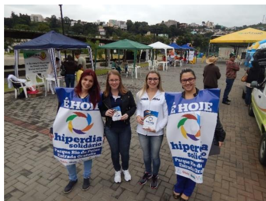
Divulgação do evento