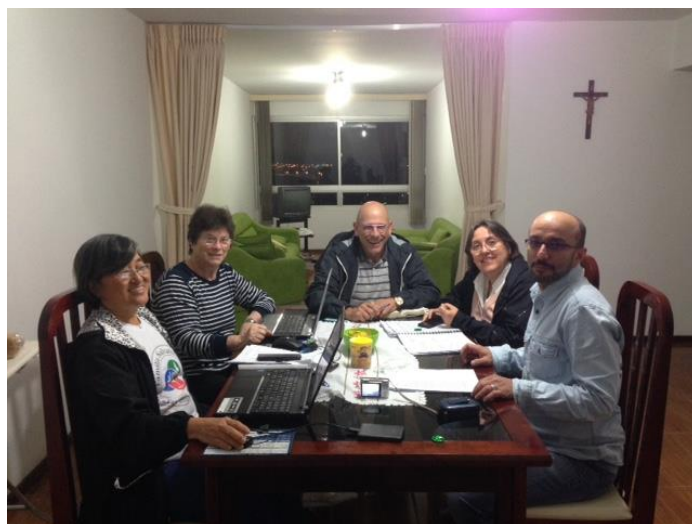
Comissão Salvatoriana da JPIC no Brasil