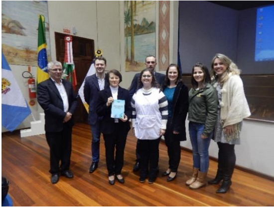
Coordenação da semana da enfermagem