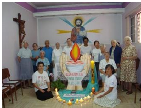
Comunidade Mater Salvatoris