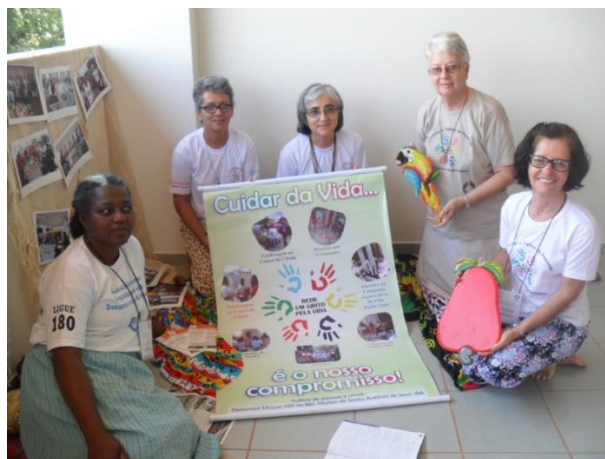
Luta contra o Tráfico Humano