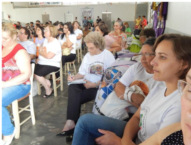
Formação de lideranças

Foram promovidos momentos formativos com pequenos grupos, comunidades e grandes grupos contando também com a presença de outras/os assessoras/es.