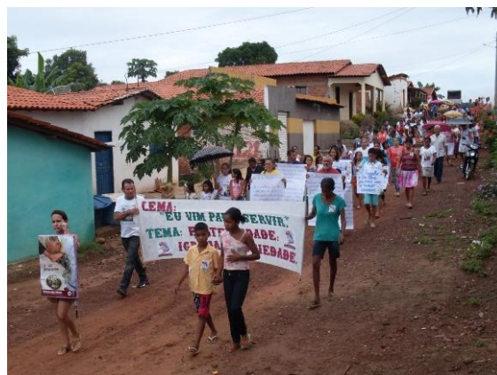
Caminhada conscientizando que Igreja e Sociedade precisam caminhar juntas