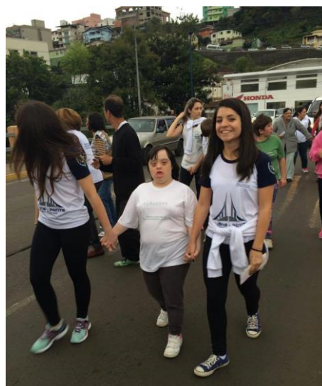
Jovens ponte trabalhando com crianças da APAE