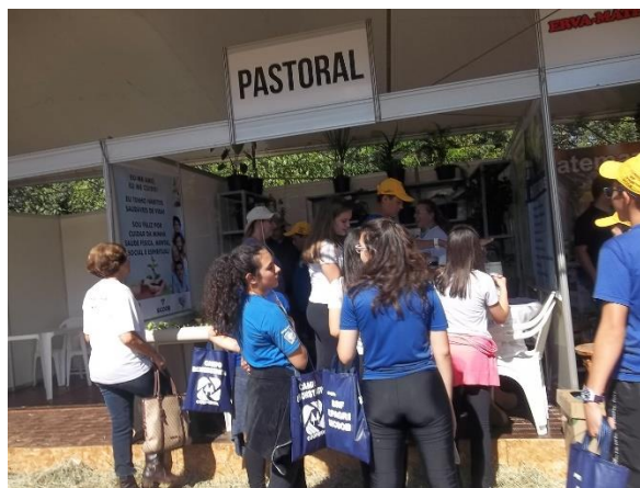
Cultivo de chás e alimentos naturais para a saúde