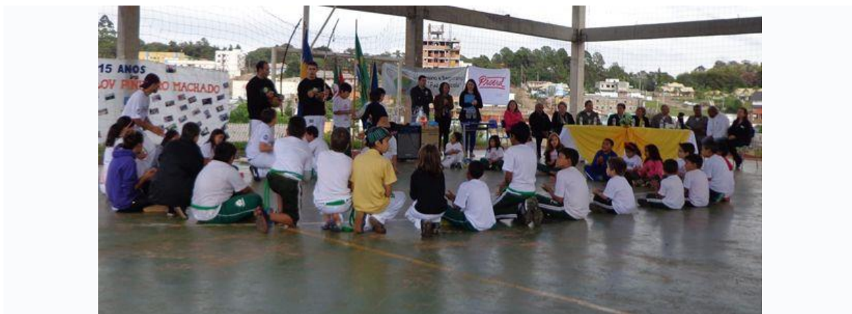
Projeto transformação em arte – Passo Fundo