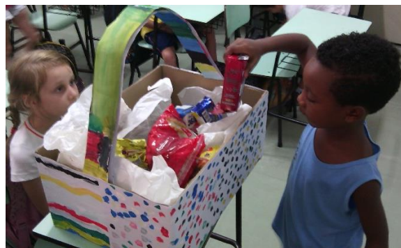
Crianças solidárias em ação