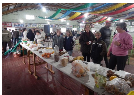
Produção de alimentos saudáveis pelas mulheres camponesas.

Uma outra atividade de fundamental importância foi a formação de lideranças nas comunidades cristãs a fim de que as pessoas possam atuar em todos os espaços em que a