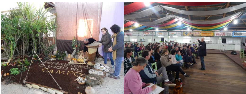
Acompanhamento as famílias camponesas no cuidado da terra