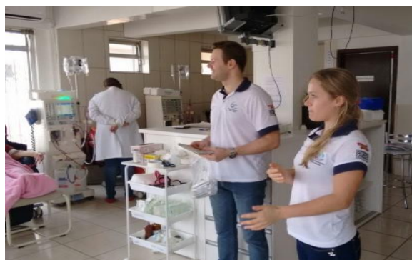
Colaboradores do HSDS, membros da CIHDOOT