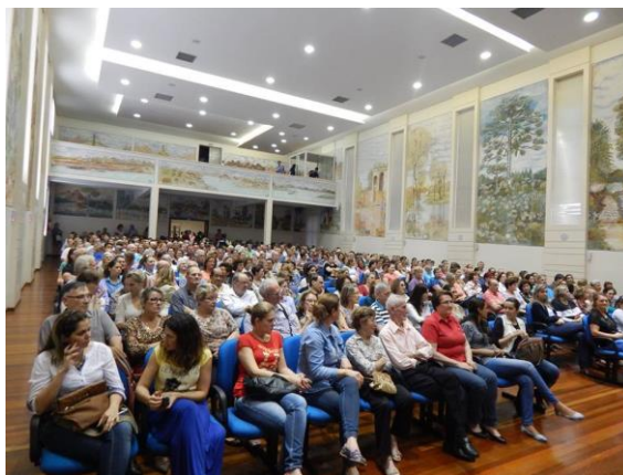
Valorização e homenagem as pessoas idosas.