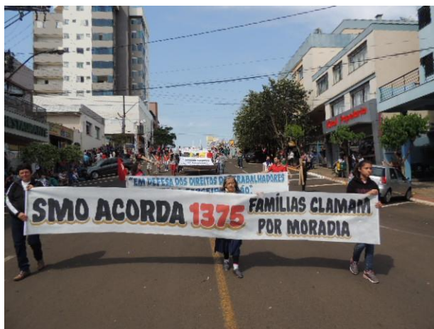
Moradia digna para todos

pagam aluguel e passam por grandes dificuldades por que o salário, resultado do trabalho, não cobrem as despesas de alimentação, vestuário, educação, saúde e outras despesas. As Irmãs da comunidade lutam junto ao povo pela organização de recursos via programas de habitação, para quem já possui terreno e junto à prefeitura municipal para aquisição de terrenos e construção de conjuntos habitacionais populares para a população de baixa renda e sem possibilidades de construir sua casa.